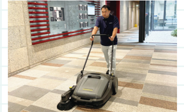
高性能な機器を導入し、品質向上を図る清掃業務