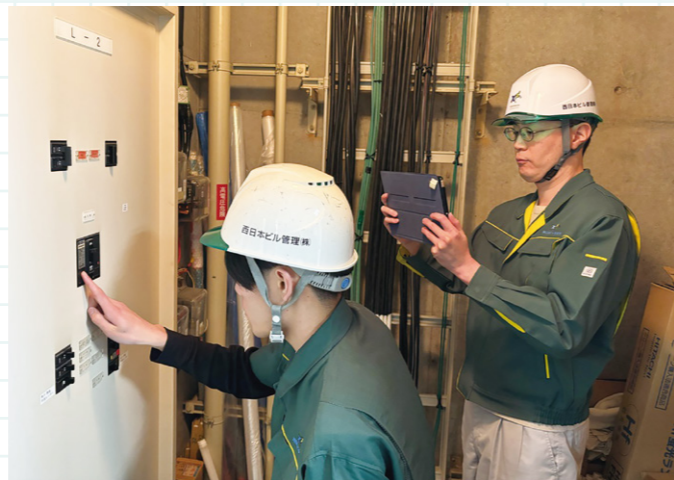
タブレット端末を使いリアルタイムで情報集約しながら電気設備の点検業務を行う設備管理業務スタッフ

また、「テックパーキング」「エコパーク」などのブランドで駐車場事業を展開。土地所有者さまの資産有効活用のお役に立てています。コインパーキングの運営は路上駐車や交通渋滞の緩和にも一翼を担っています。新設の駐車場にキャッシュレス決済可能なシステム導入も行っています。近年は、当社の得意分野を生かす形でPPP（官民連携）事業にも積極的に取り組んでいます。