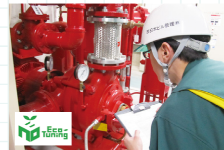
設備機器を環境に配慮した最適な状態にチューニング

私たちは「安心・安全・快適空間のサービス提供」を基本理念＝使命として活動、「働きがいと経済成長の両立」を掲げています。特に、環境省推奨のエコチューニング登録企業※として、省エネ関連を含めた改修設備工事などを提案しています。社員の技術的なレベルアップに向けて資格取得を奨励し、将来的に費用の会社全額負担を目指しています。また、社員のユニフォームは環境配慮商品を使用。“人・環境に優しい会社”を心掛け、全社員一丸となって活動しています。当社は「かがわ地方創生エスディーエスSDGs制度」にも登録しています。