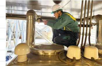
高い技術力と豊富な経験を兼ね備えた 設備管理業務スタッフ