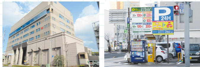
電気設備をはじめ、警備や清掃などを総合的に管理している物件 香川、岡山、高知県で展開するコインパーキング